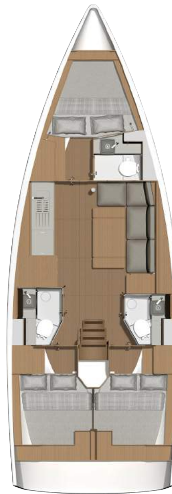
L shape galley