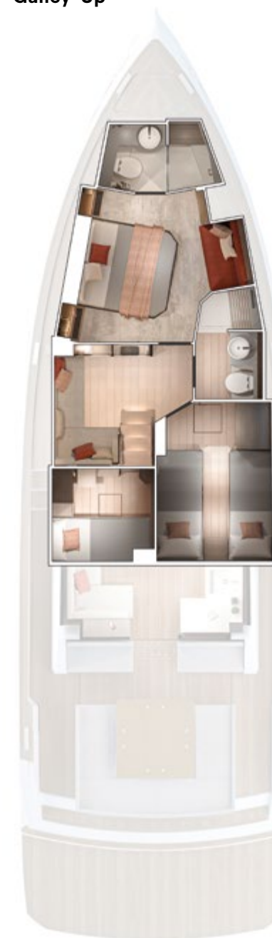
Lower deck Galley-Up