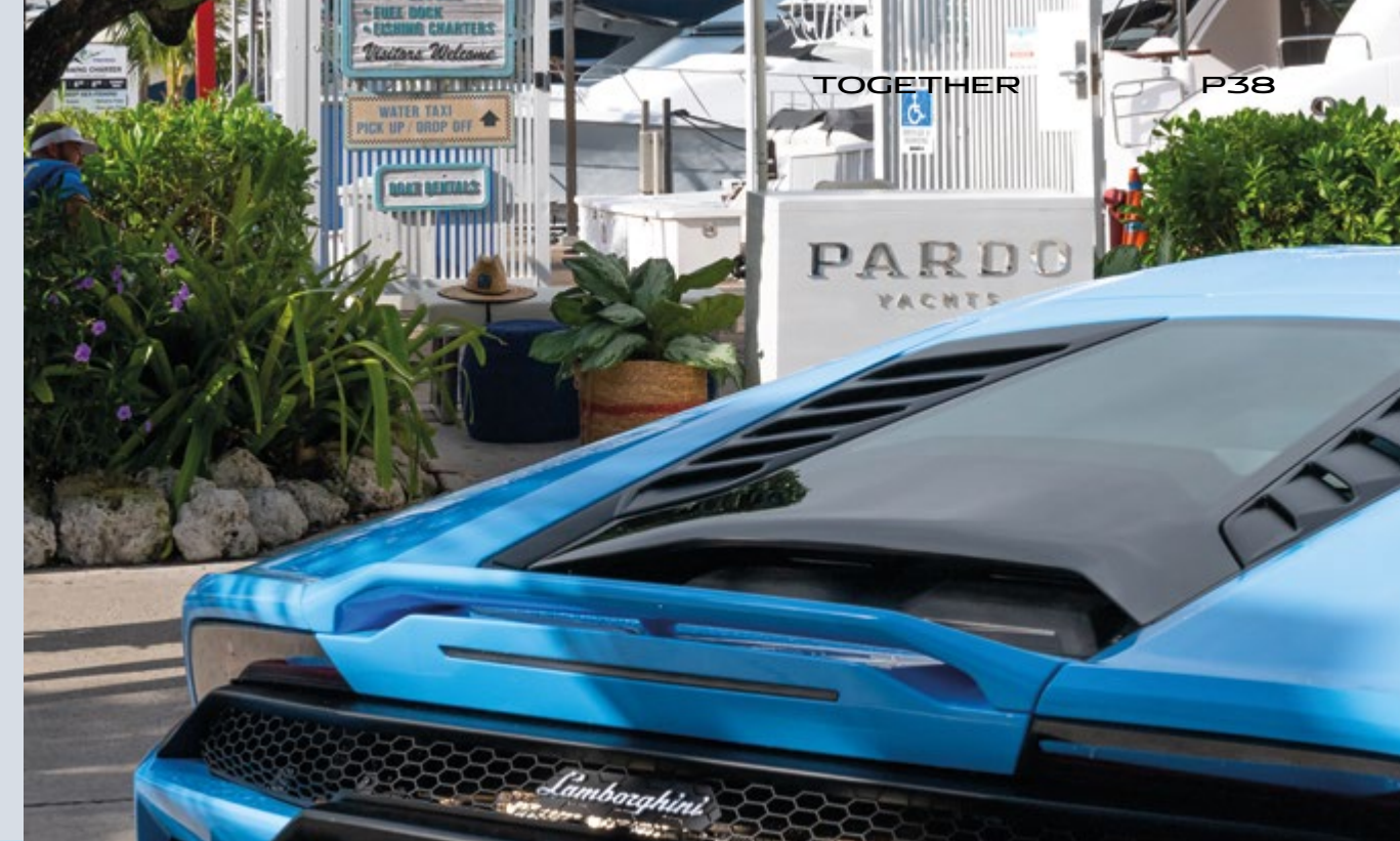
MIAMI - PARDO YACHTS & LAMBORGHINI