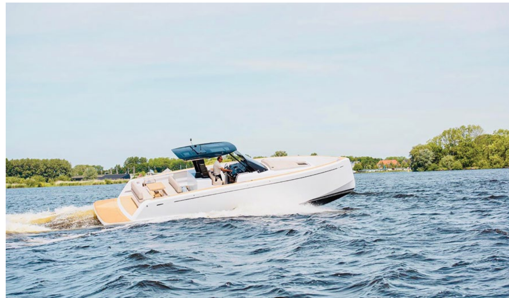
Option: electric bimini inside the T-Top Optional: bimini elettrico nel T-Top