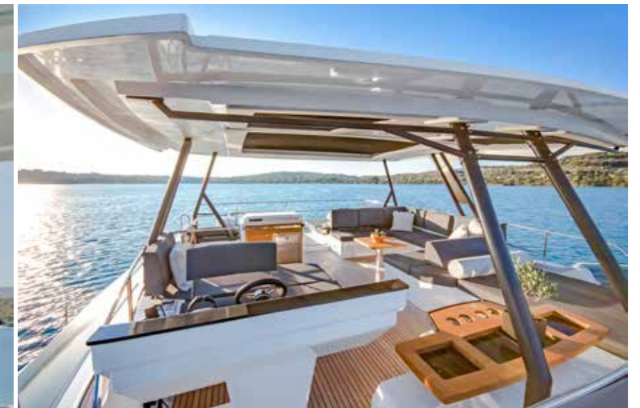
Proposé en option, le hard-top à toit ouvrant offre une protection efficace sur le flybridge, qui s'étend sur pas moins de 32 m 2 .