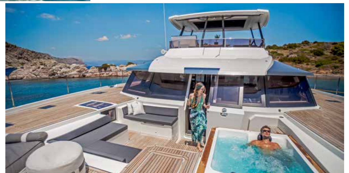
Les aménagements de l'immense pont avant font preuve d'originalité. Le jacuzzi peut être rempli d'eau douce ou salée selon les préférences de chacun. Notez l'accès direct depuis la cabine propriétaire entre les banquettes.