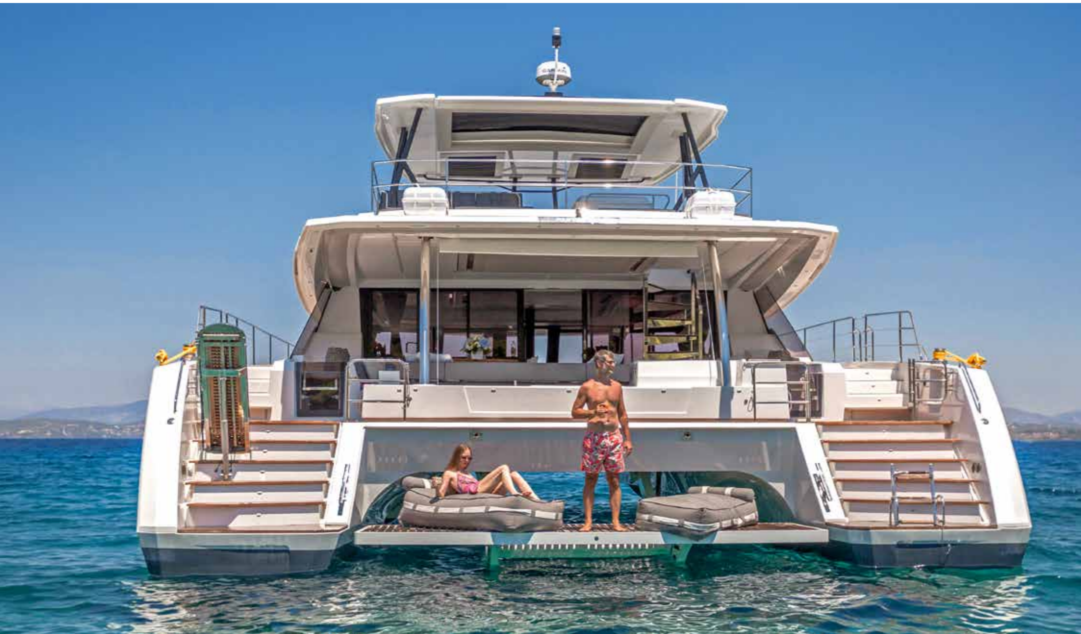
Les deux plateformes donnent facilement accès à la grande plage de bain hydraulique, qui permet d'accueillir l'annexe en navigation.

► escamotable, dressing, connexion Wifi et Bluetooth, rien ne manque en matière de confort. Dans la salle de bains, les dimensions de la douche et les toilettes séparées témoignent de l'importance accordée à cet espace privé. Cette suite est accompagnée, à bord de cette version, de quatre cabines doubles. Deux, situées dans la coque bâbord, sont accessibles depuis la timonerie, tandis que deux autres occupent l'arrière du bateau. Leurs entrées respectives s'effectuent depuis le cockpit. Toutes bénéficient d'un haut niveau d'équipement et d'une belle hauteur sous barrots. Précisons que des lits superposés sont aussi proposés.