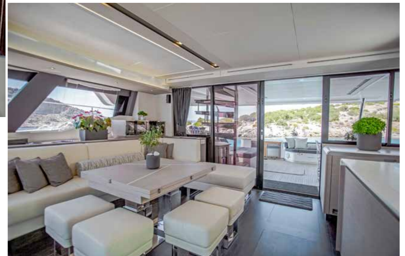
La lumière naturelle entre généreusement par les quatre côtés. Ouverte, la large baie vitrée offre une circulation facile entre l'intérieur et le cockpit, situés de plain-pied.