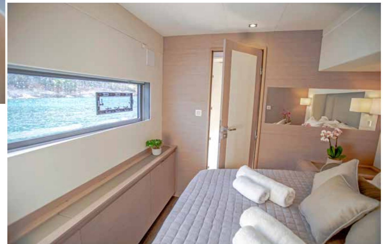
Grandes ouvertures, connexion Bluetooth, téléviseur escamotable, vastes rangements... Les quatre cabines dédiées aux invités bénéficient d'un haut niveau d'équipement.

► pêche pas d'arborer une allure contemporaine, qui lui permet de s'intégrer sans heurt au design général du bateau. La timonerie, accessible depuis le cockpit en ouvrant une baie coulissante à quatre vantaux, abrite également un agréable espace repas avec une table dépliant, une méri-dienne et une table à carte.