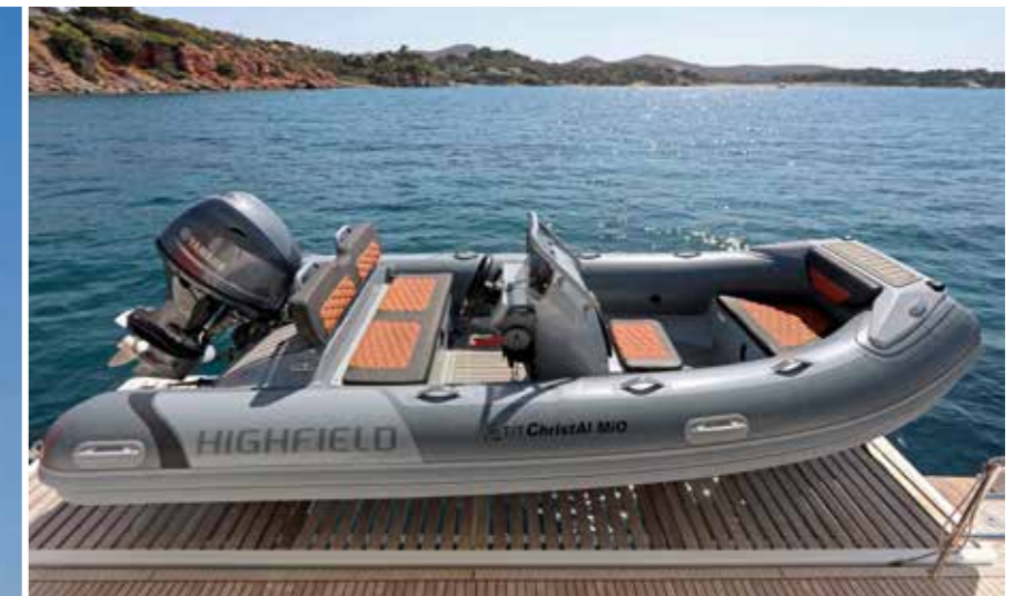
L'argument déterminant pour choisir l'annexe a été son poids. Celle-ci devait être suffisamment lourde pour demeurer confortable sur des eaux agitées.