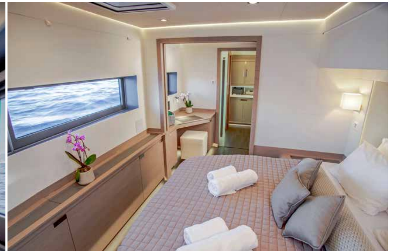
Les deux larges ouvertures de bordé sont situées à bonne hauteur pour offrir une vue sur les flots dans la mastercabin. Notez la présence d'un bureau en enfilade avant d'accéder à la salle de bains.