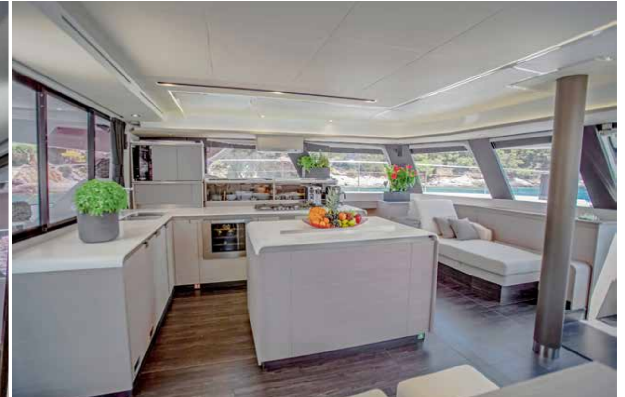
Avec son important îlot central, la cuisine présente un aspect très convivial. Une autre version d'aménagement permet de l'installer au niveau inférieur, pour disposer d'un grand salon. L'épontille rappelle la place du mât à bord de l'Alegria 67.

LE COCKPIT joue aussi à merveille son rôle de carrefour de circulation. Celui-ci donne facilement accès à la salle des machines, à la passerelle hydraulique ainsi qu'à l'escalier menant au flybridge. Avec ses 32 m 2 de surface, celui-ci n'a rien à envier en matière de confort à son voisin du dessous. Une méridienne et deux grands baignades de soleil jouxtent le salon de pont, conçu pour accueillir huit personnes, tandis qu'un meuble de cuisine optionnel prend place à proximité directe de la trappe de descente. Sur tribord, le poste de