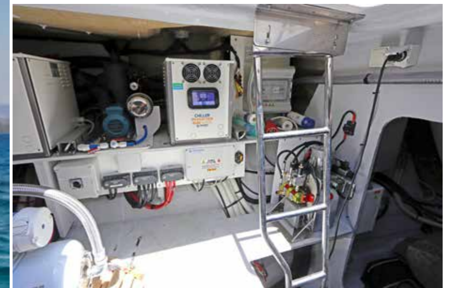
Les deux cales moteurs offrent un accès facile à la plupart des éléments techniques comme l'unité de réfrigération dédiée à la climatisation, au milieu sur la photo.