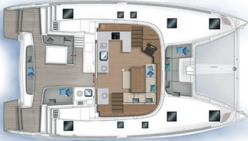
Carré et cockpit / Saloon and cockpit