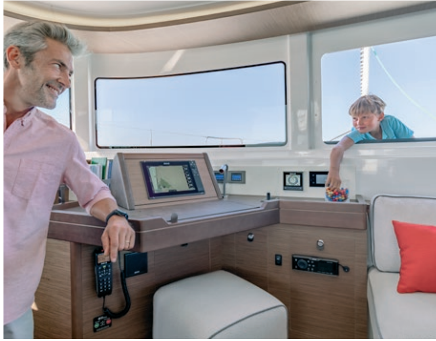
VITRAGE COULISSANT OUVERT. SLIDING SASH WINDOW OPENED.