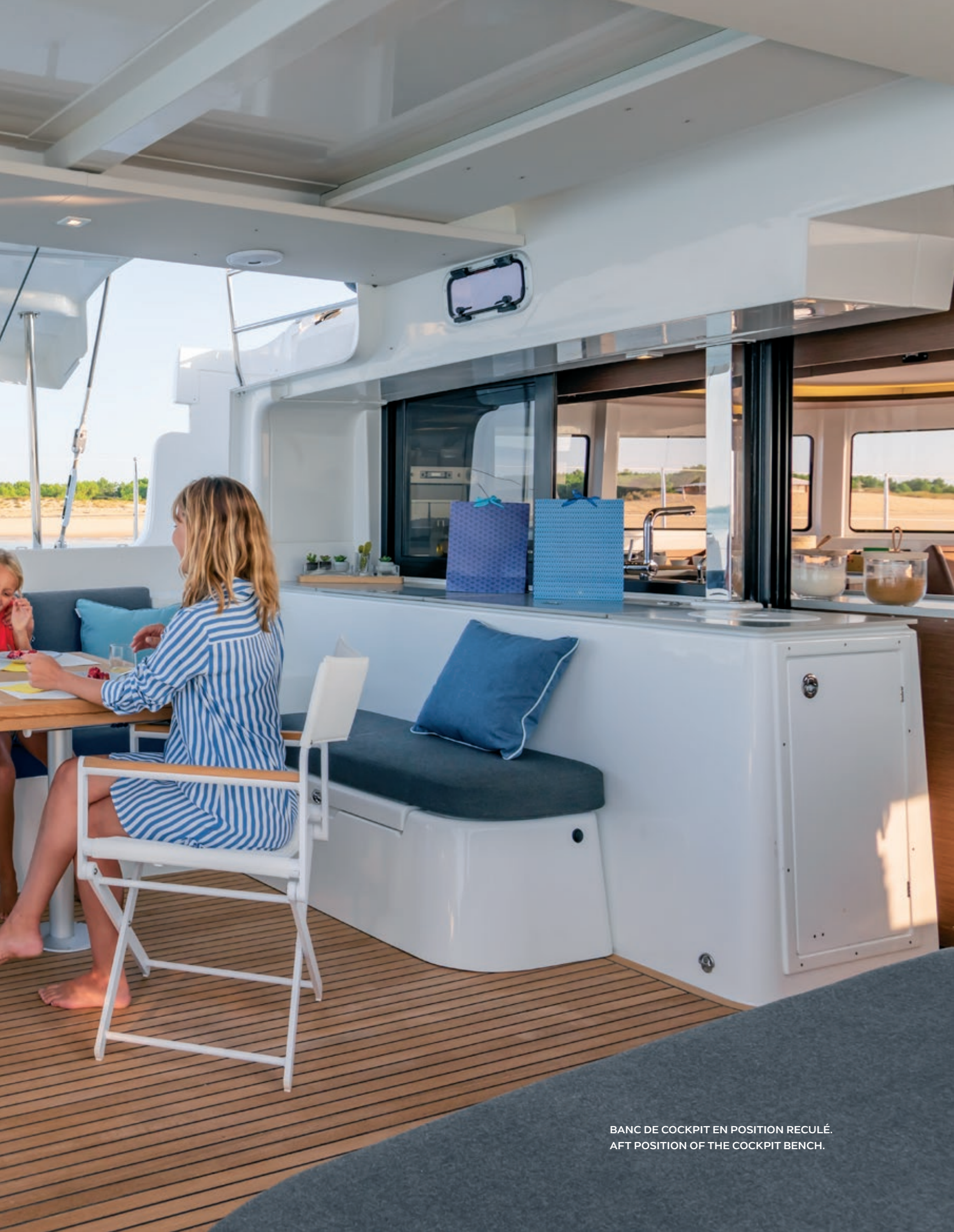
BANC DE COCKPIT EN POSITION REULÉ. AFT POSITION OF THE COCKPIT BENCH.