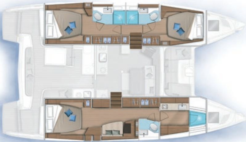
3 cabines, 3 salles d'eau / 3 cabins, 3 bathrooms