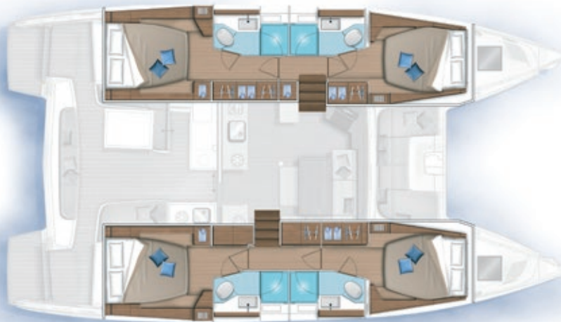
4 cabines, 4 salles d'eau / 4 cabins, 4 bathrooms